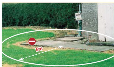
les sources, forages et puits