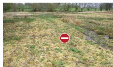
les zones humides