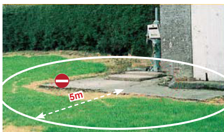
les sources, forages et puits