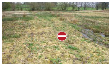
les zones humides